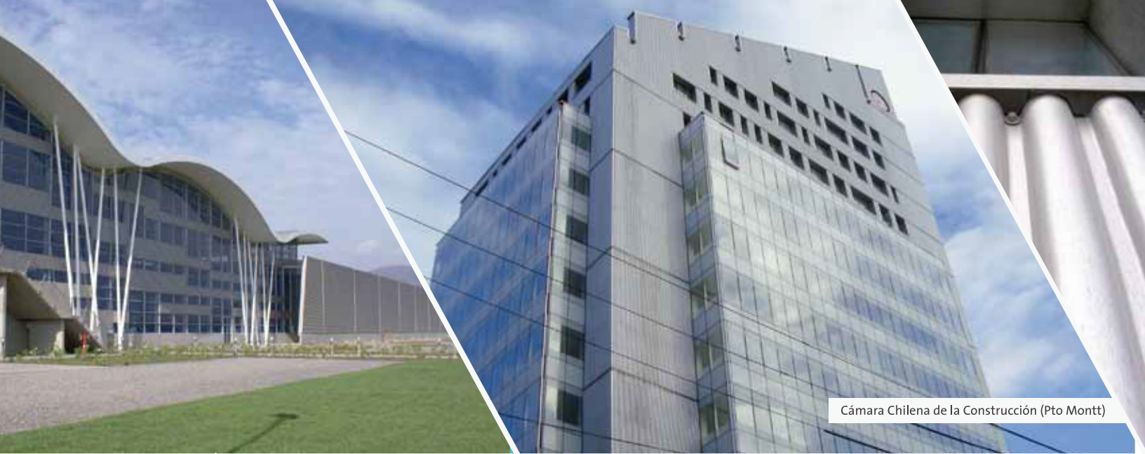
Cámara Chilena de la Construcción (Pto Montt)