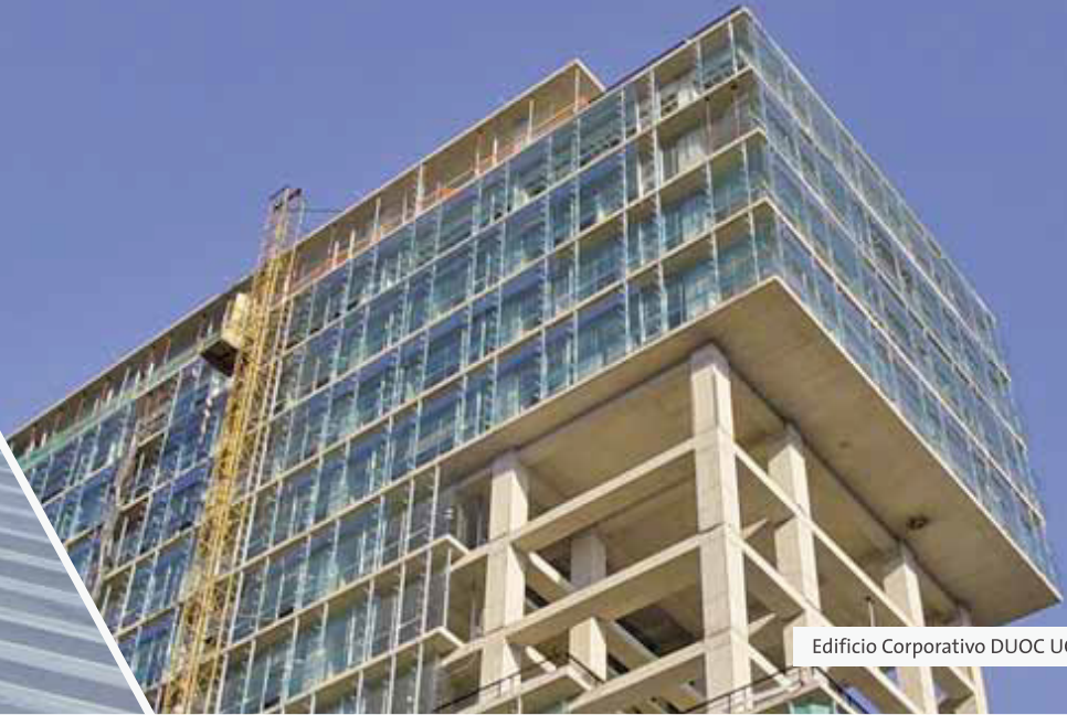
Edificio Corporativo DUOC UC